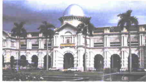
Stesen Kereta Api

Bandar Raya Ipoh tidak mempunyai bangunan tinggi seperti Kuala Lumpur. Bagaimanapun bangunan-bangunan baru dan beberapa buah bangunan lama di bandar ini sungguh menarik. Stesen Kereta Api Ipoh adalah bangunan lama yang mempunyai bentuk senibina Moorish yang unik. Bentuk bangunan ini hampir sama dengan bentuk bangunan Stesen Kereta Api Kuala Lumpur.