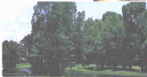
Taman Dr. Seeni-vasagam

Di tengah-tengah kawasan bandar ini terdapat Taman Dr. Seeni-vasagam. Taman ini merupakan tempat orang ramai bersiar-siar sambil berehat. Di sini juga disediakan gelanggang kasut roda, taman permainan dan kereta api mini.