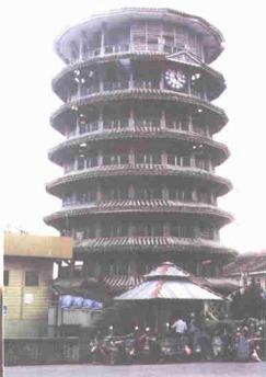
Menara Jam Condong Teluk Intan

tengah bandar masih kukuh sebagai lambang Bandar Teluk Intan. Menara ini dikatakan telah berusia lebih 100 tahun yang didirikan pada tahun 1885. Menara ini berbentuk pagoda condong yang menyerupai bangunan Pisa di Itali. Bangunan ini telah dibina oleh seorang kontraktor Cina bernama Leong Choon Choong.