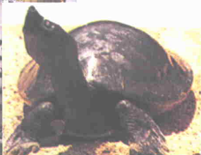
Tuntung, di Pusat Penetasan Bontu Kanan, Perak

tengah bandar masih kukuh sebagai lambang Bandar Teluk Intan. Menara ini dikatakan telah berusia lebih 100 tahun yang didirikan pada tahun 1885. Menara ini berbentuk pagoda condong yang menyerupai bangunan Pisa di Itali. Bangunan ini telah dibina oleh seorang kontraktor Cina bernama Leong Choon Choong.