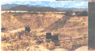
Lombong Bijih Timah