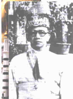
Sultan Yusuf Izuddin Shah